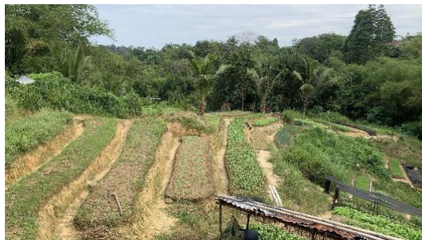
Gambar 3. Perkebunan Sayur (Ibu Lusi Pangala)

Ini adalah ilustrasi dari proses manajemen rantai pasok pada Usaha Mikro, Kecil, dan Menengah (UMKM) dalam pengelolaan hasil Perkebunan sayur, yang dibuat berdasarkan wawancara dan observasi langsung di lokasi usaha: